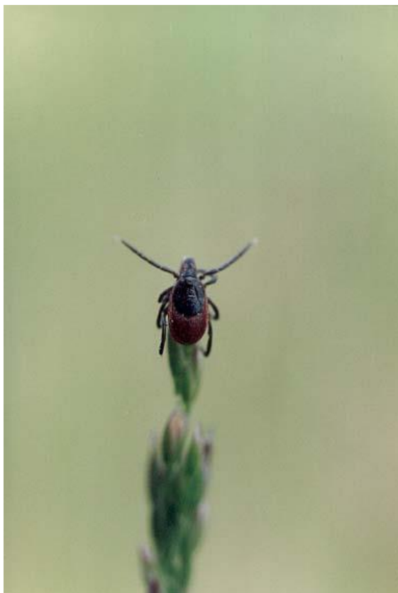
Рис. 1. Таежный клещ на травинке в позе ожидания

дельную емкость, подписав фамилию пострадавшего. Клещей доставить в лабораторию как можно скорее для выполнения исследования.