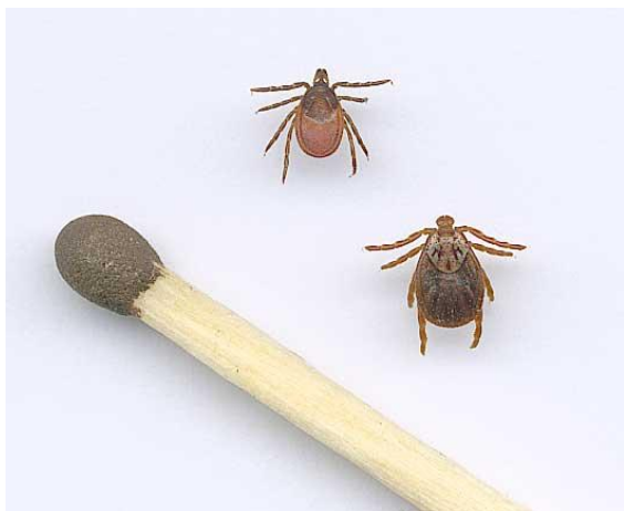
Рис. 3. Сравнительные размеры клещей (выше и левее расположена самка рода Иксодес, ниже и правее — самка рода Дермацентор)