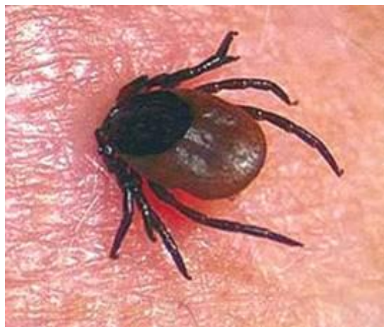
Рис. 4. Самка рода Иксодес, присосавшаяся к коже человека