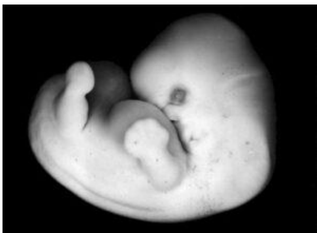
Фото эмбриона до 4й недели беременности.

У эмбриона формируется сердце, головка, ручки, ножки и хвост щель. Длина эмбриона на пятой неделе доходит до 6 мм.